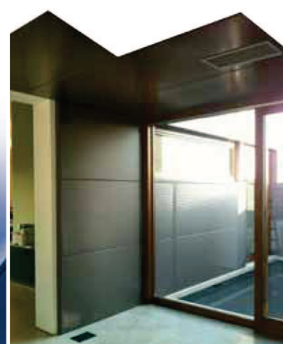
Rivestimento interno Pannelli sandwich in interno/esterno/soffitto